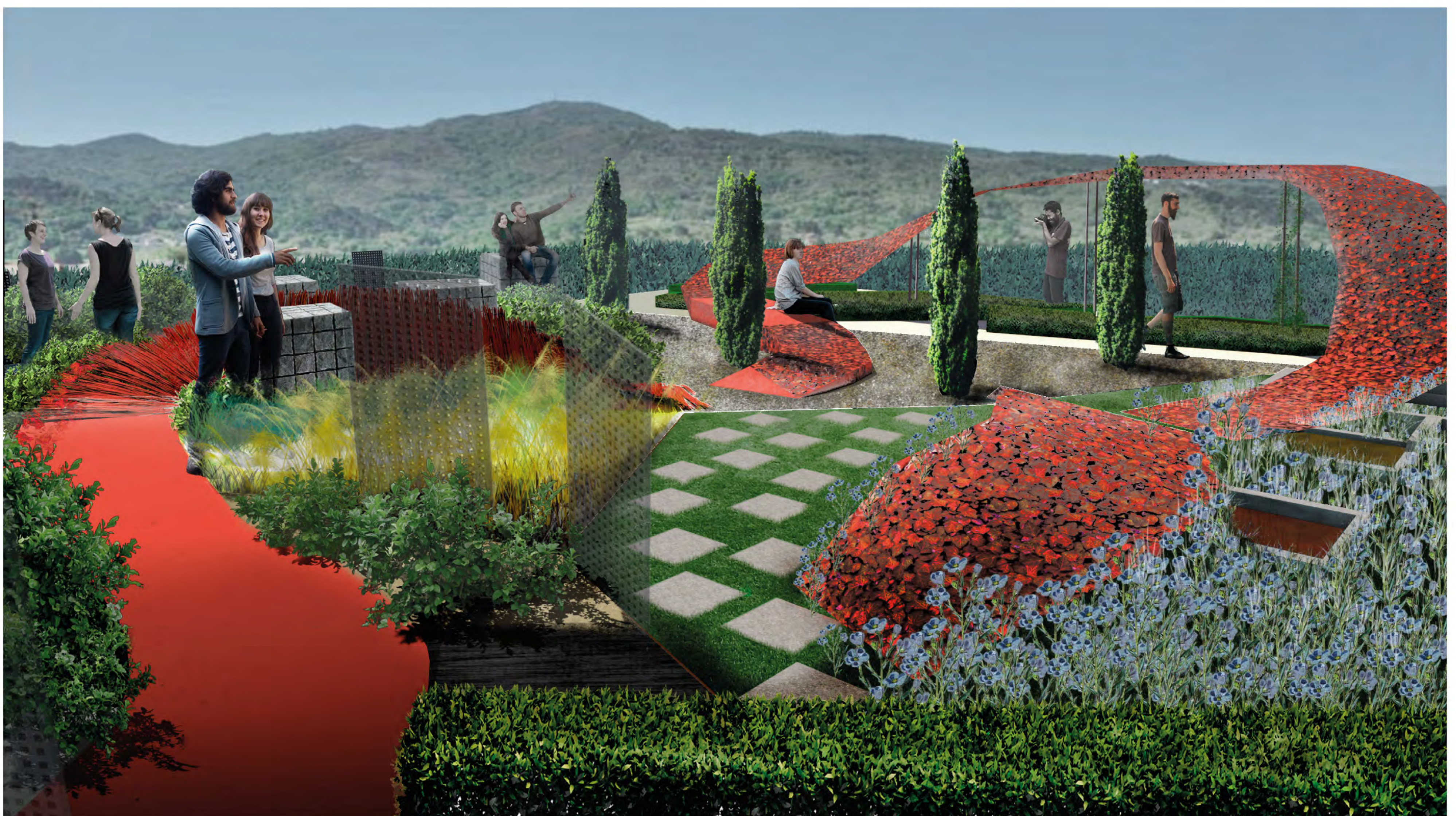
Vista en perspectiva